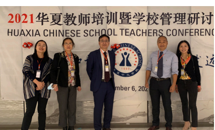
纽约中心分校团队