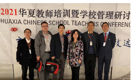
李文斯顿分校团队