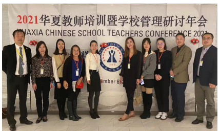
史泰登岛分校团队